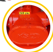
Heavy Duty Gear Box