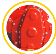
Heavy Duty Side Cover