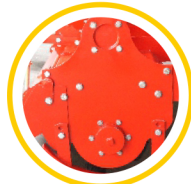
Heavy Duty Side Body